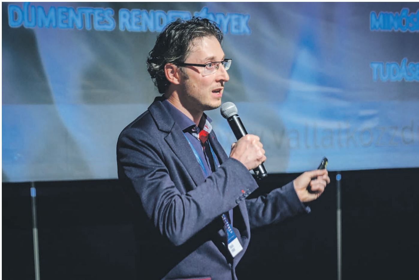
Ballai Máté Bács-Kiskunban is segíti a vállalkozások digitális fejlesztését

JÁRVÁNY OKOZTA VÁLSÁG Kik vették eredményesen az akadályt?