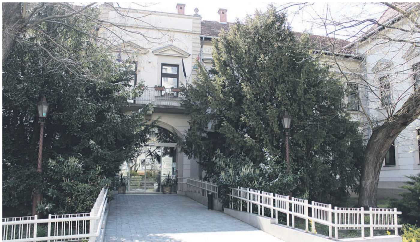
A megyei kereskedelmi és iparkamara székháza. A szervezet vezetőségének több javaslata is visszaköszön a gazdasági újraindítás kormánydöntéseiben

PANDÉMIA A kormány figyelembe vette a kamarák javaslatait